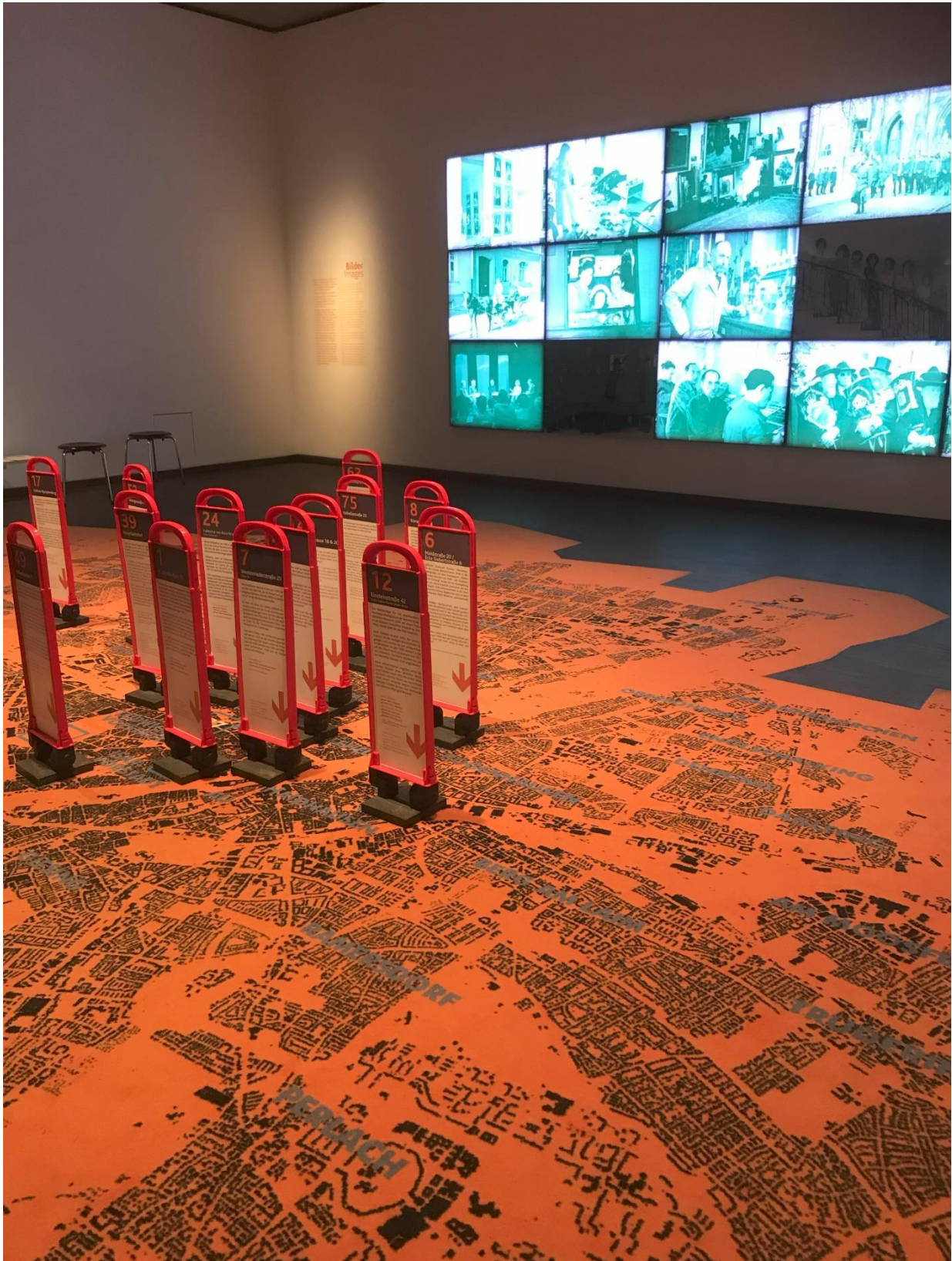
Exkursion nach München „Jüdisches Leben damals und Heute“

Eindrücke von einzelnen Veranstaltungen und Aktionen: