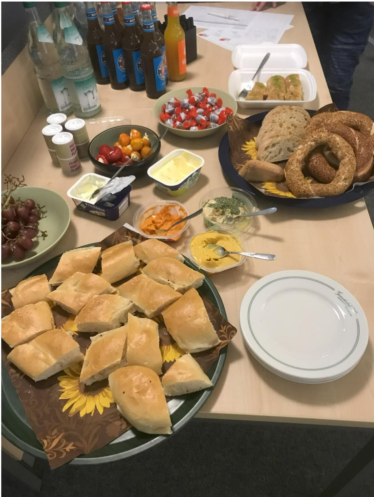
Film- und Diskussionsabend: „Masel Tov Cocktail“