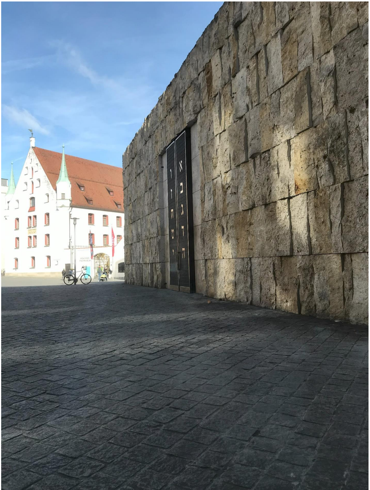
Exkursion nach München „Jüdisches Leben damals und Heute“

B ü n d n i s [ & ] B i l d u n g g e g e n A n t i s e m i t i s m u s