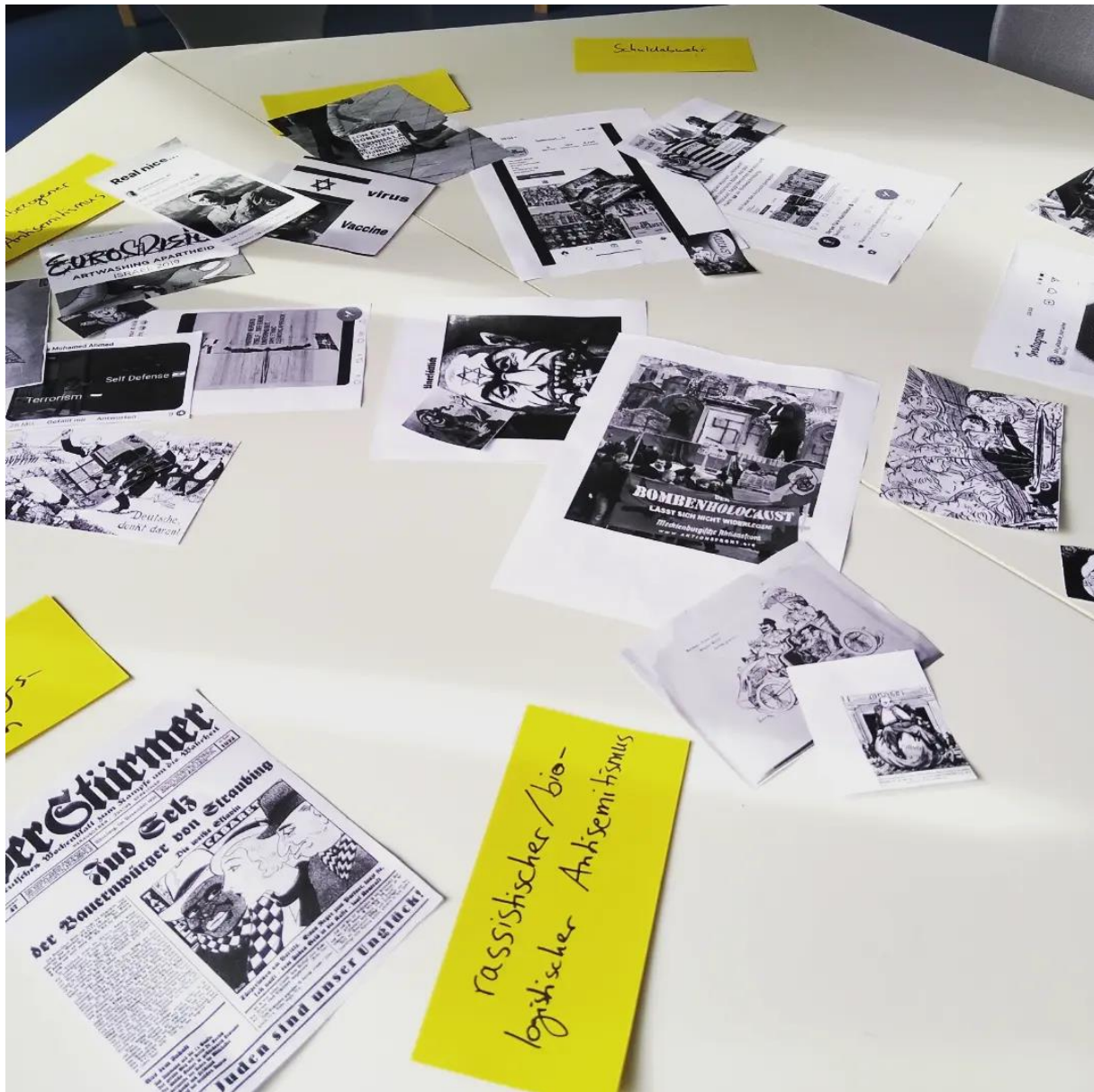
QUARARO Modulentwicklung: Antisemitismus